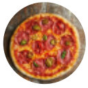
Pizze Di Carne