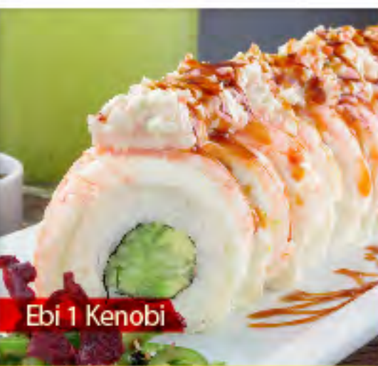
Ebi 1 Kenobi