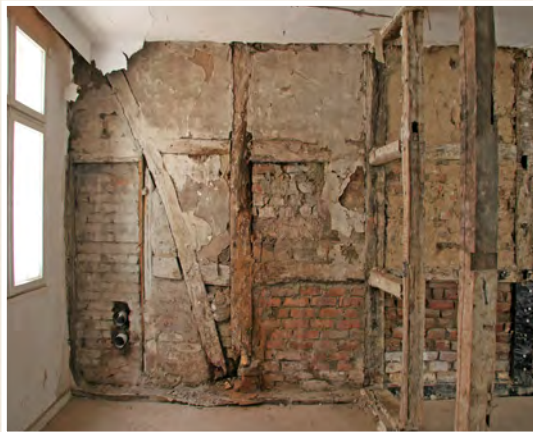
Kaum zu glauben: So sah das Haus vor der Sanierung aus.