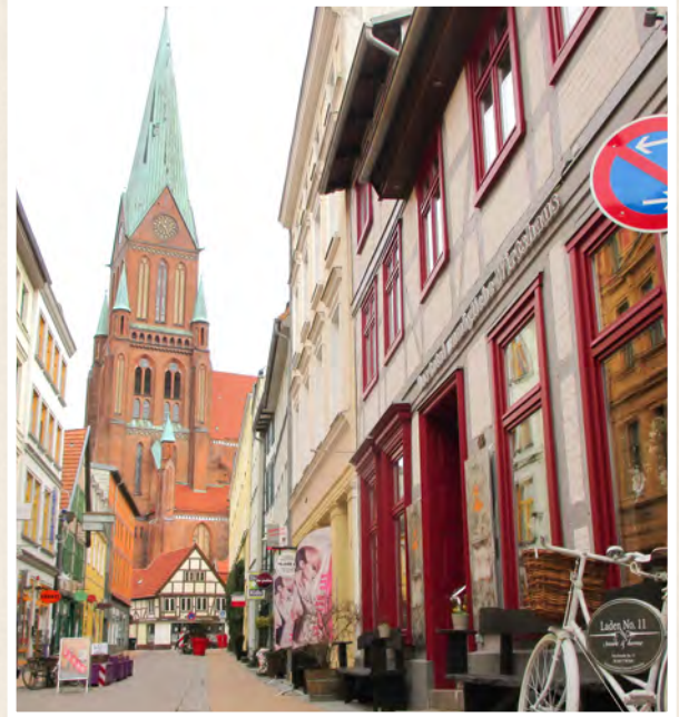
Kartoffelhaus Schwerin mit Blick auf den Schweriner Dom

Apropos Nase. Auch wenn es im Kartoffelhaus den guten Kartoffelschnaps gibt - rote Knollen-Nasen lassen sich hier selten nieder. Dafür all jene, die Kartoffelgerichte aus Ofen und Pfanne über alles lieben. Hier in der Buschstraße ist nämlich das Reich der 25 Knollengerichte. Die Karte hat einiges auf der Pelle. Rindercarpaccio vom Weideochsen, Warmer Gemüse-Tofu-Burger, Omas Sauerfleisch im Glas, auf der Haut gebratenes Zanderfilet oder der Grillteller vom Lavasteingrill - das Angebot ist vielfältig. Und immer dreht sich alles um die Knolle. Mal räkelt sie sich als deftige Bratkartoffel auf dem Teller, mal als Bauern-Rösti, Kartoffelnudel, dampfende Stampfkartoffel oder kesse Krokette.