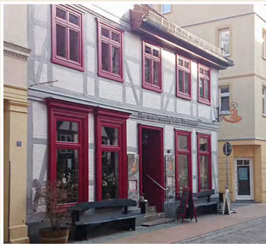
Das neue Kartoffelhaus in der Buschstraße erstrahlt wieder im neuen Glanz. Nach einer umfangreichen Sanierung lädt es seine Gäste zum Verweilen ein.

Sie gilt zurecht als eine der beliebtesten kleinen Einkaufsstraßen. Mitten in der historischen Altstadt befindet sich die Buschstraße. Es ist eine kleine Erlebnismeile, in der sich Boutiquen, Töpferei und Restaurants wie eine Perlenkette aneinander fädeln. Hier lässt sich Schwerins ältestes Fachwerkhaus entdecken, das als einziges die zahlreichen Brände im 16. und 17. Jahrhundert überlebte. In der Buschstraße schießen Touristen ein Erinnerungsfoto nach dem anderen. Denn einzigartig schön ist der Blick auf den Schweriner Dom. Die Straße läuft direkt auf den unübersehbaren, backsteinroten Turm zu, der die gesamte Stadt überragt. Mittendrin in dieser schönen Meile befindet sich das Kartoffelhaus. Der Schweriner Gastronom Thomas Jiskra war so mutig, einen in der Buschstraße 14 vor sich hinrottenden „Schuppen“ in ein charmantes Fachwerkhaus zu verwandeln. Zwei Jahre dauerten die Sanierungsarbeiten. Zwei Jahre, in denen er in die Geschichte des Hauses und der Straße eintauchte. Die hieß damals noch Faule Grube. Wie der Name vermuten lässt, kippten die Anwohner hier fröhlich ihre Abfälle in einen übel riechenden Graben. Mitte des 19. Jahrhunderts hieß der Straßenzug dann „Wladimirstraße“, benannt nach dem russischen Großfürsten Wladimir. Ihren heutigen Namen erhielt sie 1939 nach dem