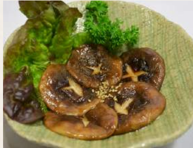
37. SHIITAKE-BATAITAME Shiitake -Pilze mit Butter gebraten