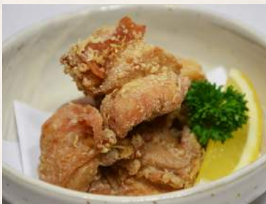
46. TORI-KARAAGE Hühnerfleisch im Öl gebacken, nach japanischer Art