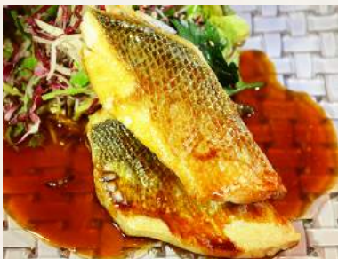
63. SUZUKI- BATA-YAKI Loup de Mer mit Butter-Sojasauce