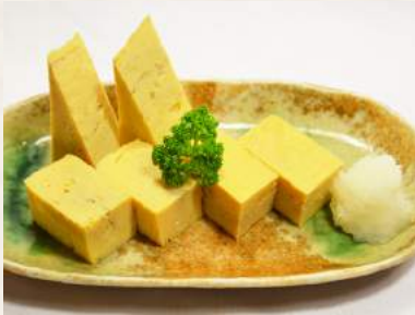
36. DASHIMAKI Eierrolle-Spezial