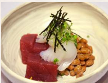
32. GENPEI-NATTOU gegorene Sojabohnen mit Tintenfisch und Thunfisch