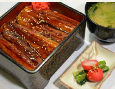
69. SPEZIALITÄT - UNAJU Grillaal auf Reis im Lackkästchen