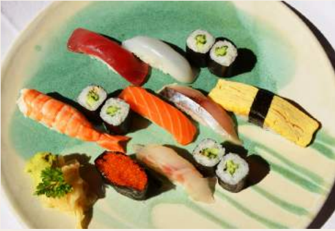
120. KAEDE Sushi Variation 8 Stück gemischtes Sushi+ 1 Rolle