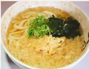
80. TANUKI-UDON in Sojabröhe mit frittierten Teig-Stückchen