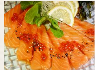
19. SHAKE-CARPACCIO Lachs an Kicho-Spezial-Sauce