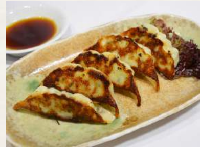
38. GYOZA japanische Maultaschen