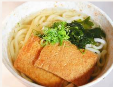
83. KITSUNE-UDON in Sojabröhe mit süßer Tofutasche