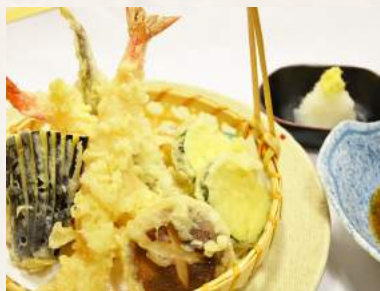
76. TEMPURA-MORIAWASE verschiedene Meeresfrüchte und verschiedenes Gemüse

※ Bild kann vom Original (leicht) abweichen