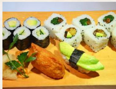
135. VEGETARISCHER-TELLER 2 verschiedene Makimono, 2 verschiedene Insideout-rolle(je 3St.)