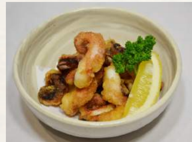
45. TAKO-KARAAGE Oktopus im Öl gebacken