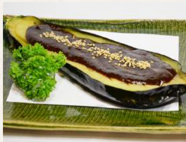
44. NASU-DENGAKU gebackene Aubergine mit Misoauce