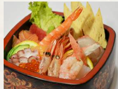
129. CHIRASHI frische verschiedene Fischfilets und Meeresfrüchte auf Sushi-Reis in einer Schale