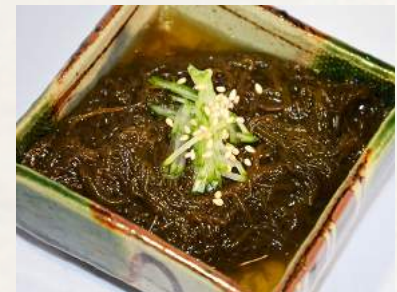
28. MOZUKU Seegras mit Dressing