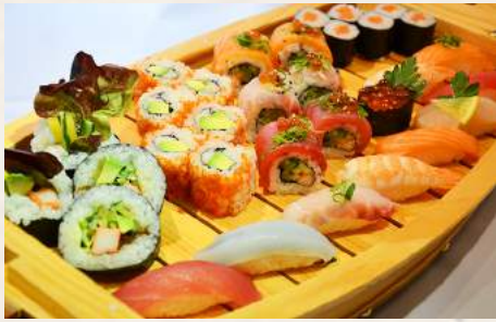
140. KICHO Deluxe-Sushi Schiffsplatte (Nigiri u.Rolle)