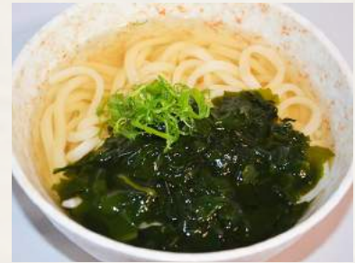
82. WAKAME-UDON in Sojabröhe mit Seetang