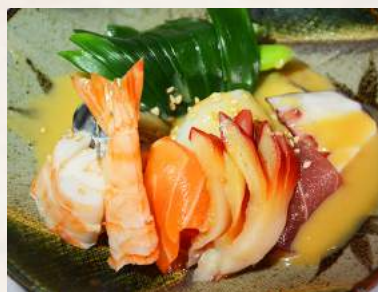
11. NUTA-AE Meeresfrüchte mit Schalotten in Miso-Dressing