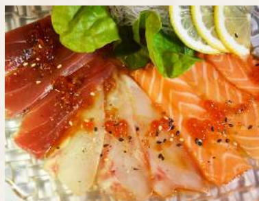
18. WAFU-CARPACCIO Lachs, Thunfischfilet und Weissfischfilet