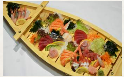
142. MATSURI Deluxe-Sashimi-Schiffsplatte