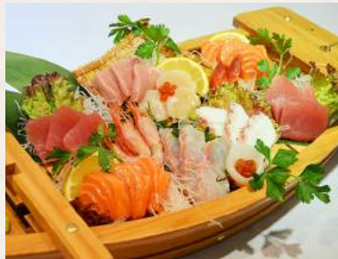
73. JO-SASHIMI-MORIAWASE DELUXE gemischte-Sashimi