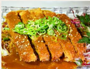
47. MISOKATSU paniertes Schweinefleisch mit Miso-Sauce

※ Bild kann vom Original (leicht) abweichen