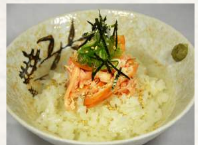
3. SHAKE-CHAZUKE gegrillter Lachs auf Reis mit heißer Teebrühe

❁ Bild kann vom Original (leicht) abweichen