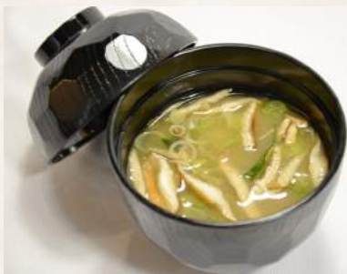
1. MISO-SHIRU Miso-Suppe