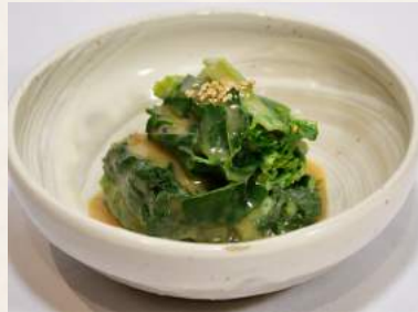
12. HORENSOU-NO-GOMAAE Zart blanchierter Spinat mit Sesamsauce