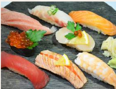
127. NIGIRI-MIRIOWASE gemischte Nigirisushi, 8 Stücke