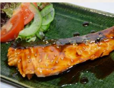
65. SHAKE-TERIYAKI Lachs mit Sojamarinade gegrillt