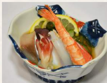
27. SUNOMONO-MORIAWASE mit japanischem Essig angemachtes Mix