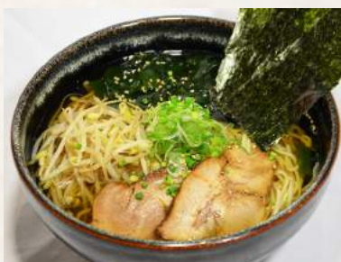
95. SHOYU-RAMEN Ramen-Nudelsuppe