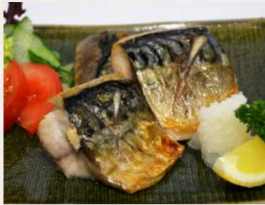
62. SABA-SHIOYAKI Makrele mit Salz gegrillt