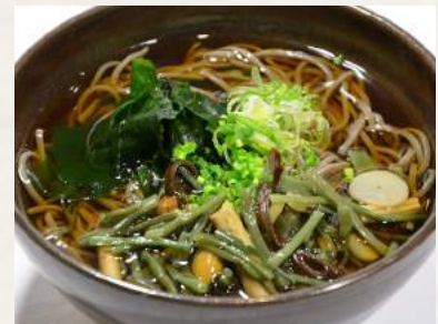
86. SANSAI-SOBA in Sojabröhe mit Berggemüse