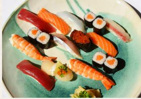
121. TSUBAKI Sushi Variation Empfehlung vom Chef 10 Stück gemischtes Sushi + 1 Rolle