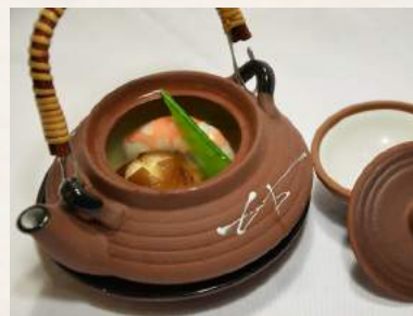
2. DOBIN-MUSHI feine Pilzsuppe mit Shrimps, Gemüse und Hühnerfleischstückchen