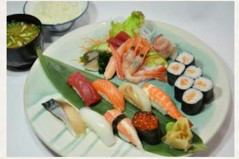
125. SAMURAI Verschiedene Sushi und Sashimi auf einem Teller dazu : Miso-Suppe und Reis