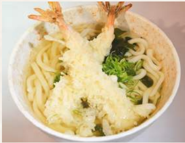
84. TEMPURA-UDON in Sojabröhe mit Tempura