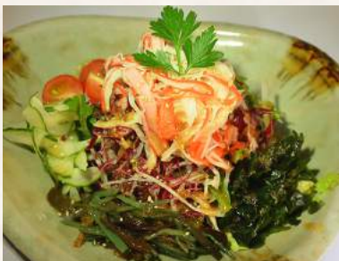
14. WAFU-SARADA japanischer gemischter Salat