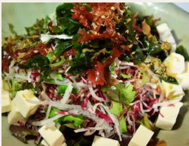
15. KAISO-TOFU-SARADA Algen-Tofusalat mit SHISO-Dressing