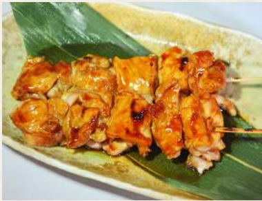
60. YAKITORI Geflügel-Grillspießchen