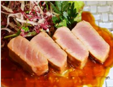
64. MAGURO-TERIYAKI Thunfisch mit Sojamarinade rosa gerillt