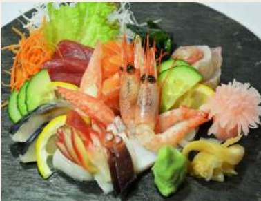
72. SASHIMI-MORIAWASE gemischte-Sashimi