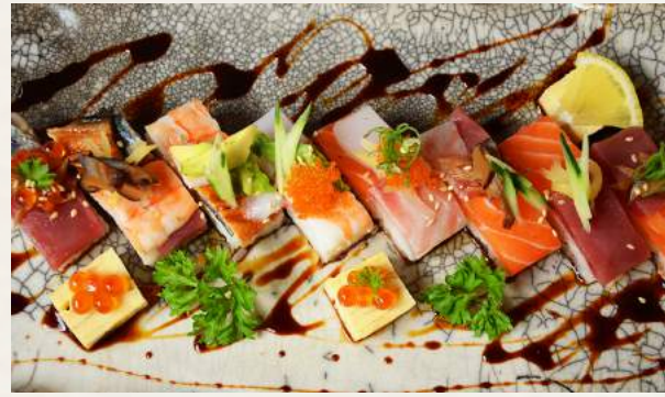
133. KACHO-FUUGETSU nach Osaka-Art arrangiertes Sushi des Tages mit spezieller Dekoration