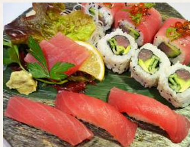
130. MAGURO-PARADIES 3 Thunfisch Nigiri, 1 Thunfisch Rolle(6St.) und 2 Thunfisch Sashimi