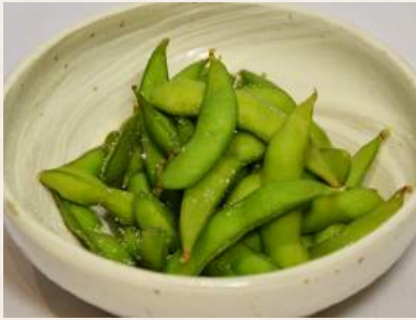
10. EDAMAME Japanische grüne Bohnen mit Salz gekocht