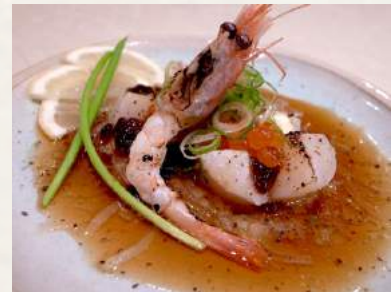
42. ABURI-HOTATE Leicht gegrillte Jakobsmuscheln mit Butter-Ponzu-Soße