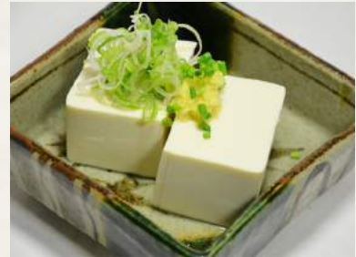
13. HIYAYAKKO Tofu, kalt serviert