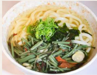
81. SANSAI-UDON in Sojabröhe mit Berggemüse