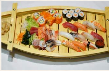
141. SHOUGUN Deluxe-Sushi u. Sashimi-Schiffsplatte