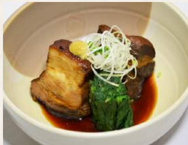
41. BUTA-KAKUNI Schweinefleisch in süßer Sojasauce gekocht