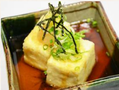
43. AGEDASHI-TOFU gebackener Sojabohnenquark