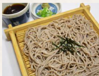
90. ZARU-SOBA mit Spezialsauce (kalt serviert)