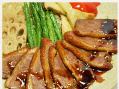
66. KAMO-TERIYAKI Entenbrust mit Sojamarinade gegrillt