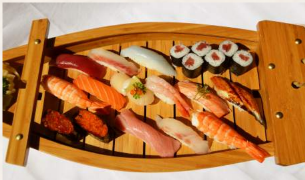
122. SAKURA DELUXE Sushi Variation Empfehlung vom Chef 14 Stück gemischtes Sushi + 1 Rolle