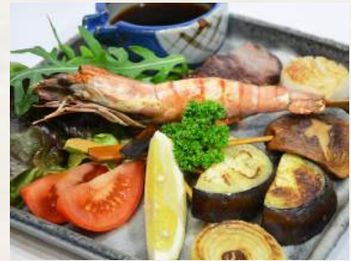
61. KUSHIYAKI-MORIAWASE gemischete gegrillte Spieße ( 5 Stück )