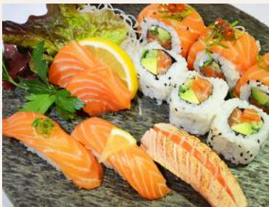
131. SHAKE-PARADIES 3 Lachs Nigiri, 1 Lachs Rolle (6 St.) und 2 Lachs Sashimi