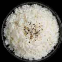
JASMIN RIS 1 portion Kr. 29