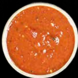
SPICY MISODIP Lille Kr. 15 / Stor Kr. 40