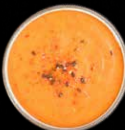
SPICY SAUCE Lille Kr. 15 / Stor Kr. 40