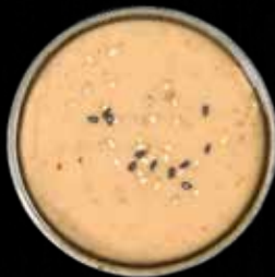
GOMA DRESSING Lille Kr. 15 / Stor Kr. 40