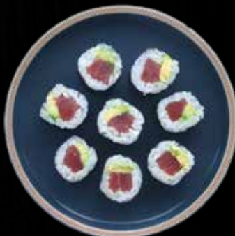
HOSO TUN M. AVOCADO Kr. 55