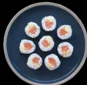
HOSO LAKS M. HVIDLØG Kr. 55