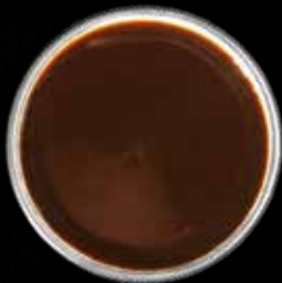
TERIYAKI SAUCE Lille Kr. 15 / Stor Kr. 40