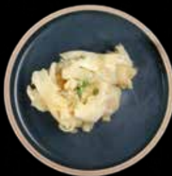
INGEFÆR Lille Kr. 15 / Stor Kr. 40