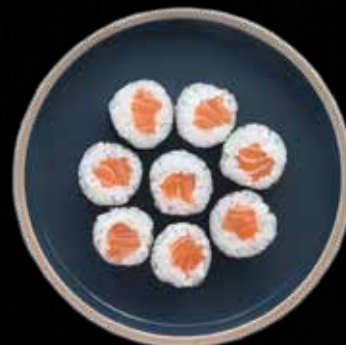
HOSO LAKS Kr. 55