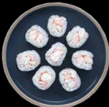
HOSO REJE Kr. 55