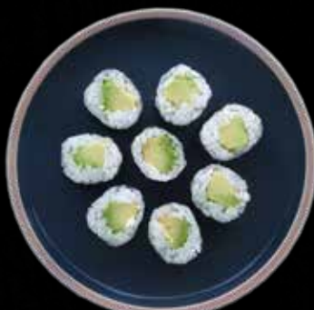
HOSO AVOCADO Kr. 55