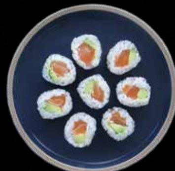
HOSO LAKS M. AVOCADO Kr. 55