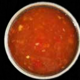
SØD CHILISAUCE Lille Kr. 15 / Stor Kr. 40