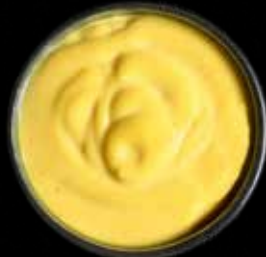
SAFRAN AIOLI Lille Kr. 15 / Stor Kr. 40