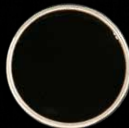
UNAGI SAUCE Lille Kr. 15 / Stor Kr. 40