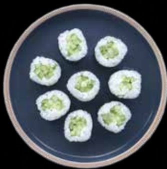
HOSO AGURK Kr. 50