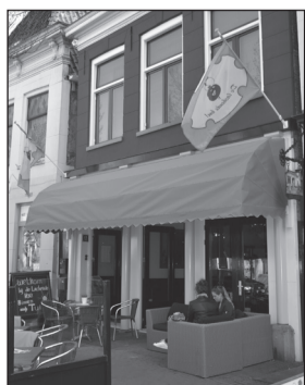
Eetcafé De Lachende Koe Harlingen