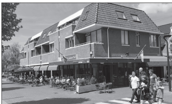
Eetcafé De Lachende Koe Drachten