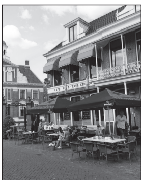
Eetcafé De Lachende Koe Heerenveen

Er zijn in Nederland veel koeien. Ze vormen een belangrijke bron voor voeding en inkomsten. Een aantal cijfers over koeien op een rijtje: aantal koeien in Nederland: 4,5 miljoen, aantal boerderijen met melkkoeien: 30 duizend, gemiddeld aantal koeien per bedrijf: 50 koeien, koeien per jaar geslacht voor vlees: 1 miljoen kalveren per jaar, geslacht voor vlees: 1,5 miljoen, melk per dag per koe: 20 tot 30 liter, een koe drinkt per dag: 150 liter water, gewicht van een koe: 700 kilogram, gemiddelde leeftijd van een koe: 6 tot 8 jaar.