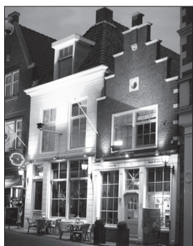
Eetcafé De Lachende Koe Leeuwarden