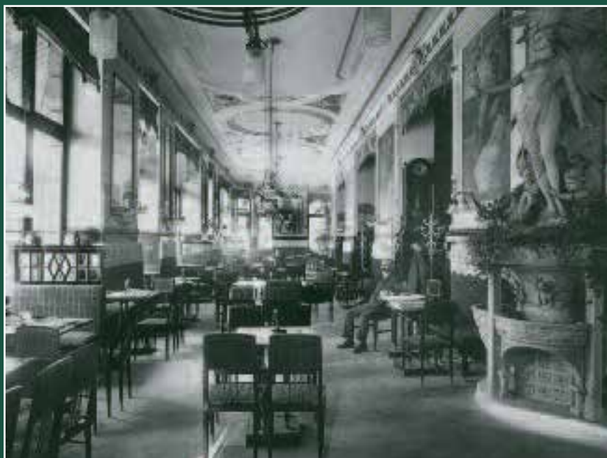
Café Prückel, anno 1910