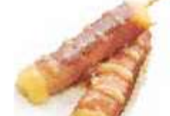
Y5 Cheese Yaki (Bœuf au fromage) 4.20€