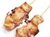
Y3 Teba (Aile de poulet) 3.80€