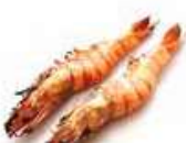
Y7 Ebi (Gambas) 5.50€