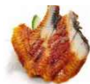
SA6 Unagi (Anguille) 9.50€