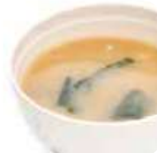
A4 Soupe Miso (Tofu, algues, poireaux, champignon) 2.50€