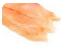
SA3 Tai (Daurade) 9.00€