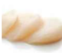
SA7 St jacque (8 pièces) 9.50€