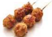
Y2 Tsukune (Boulettes de poulet) 3.80€