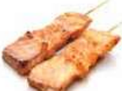
Y9 Shake Yaki (Saumon) 4.80€