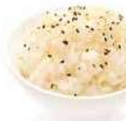
A3 Riz vinaigré 2.80€