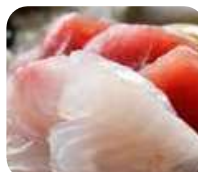
SA7 Assortiment de sashimi (12 pièces) 10.50€