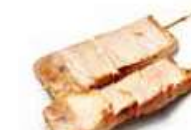
Y11 Maguro (Thon) 4.50€