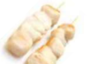
Y8 Hotate (Coquille Saint-Jacques) 5.50€