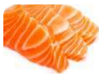
SA1 Shake (Saumon) 8.50€