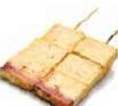
Y13 Tofu (pois fermente) 3.50€