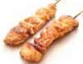
Y1 Syoniku (Poulet) 3.80€