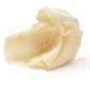
A2 Gingembre 1.80€