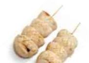
Y10 Kinoko (Champignon) 3.50€