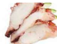
SA5 Tako (Poulpe) 8.50€