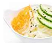
A5 Salade japonaise (A base de chou blanc assaisonné) 2.50€