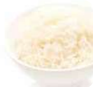
A1 Gohan (Riz nature) 2.00€