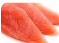
SA2 Maguro (Thon) 9.50€