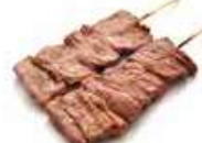
Y4 Gyuniku (Bœuf) 4.00€